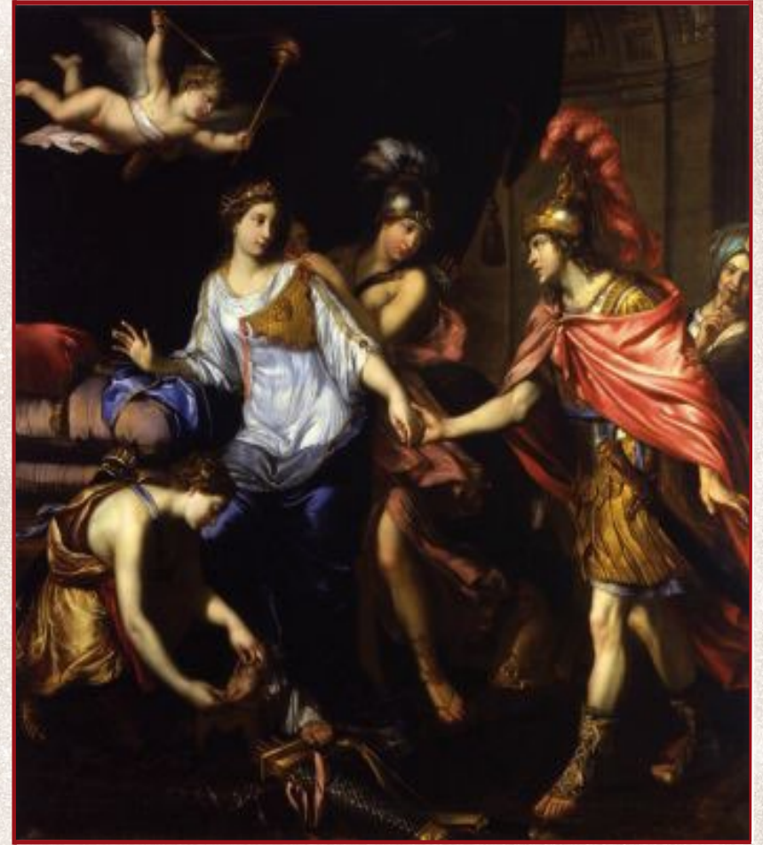
La rencontre d'Alexandre le Grand avec la reine des Amazones, tableau réalisé par Pierre Mignard, en 1660

Je vous souhaite une année toute neuve. Béatrice Viard