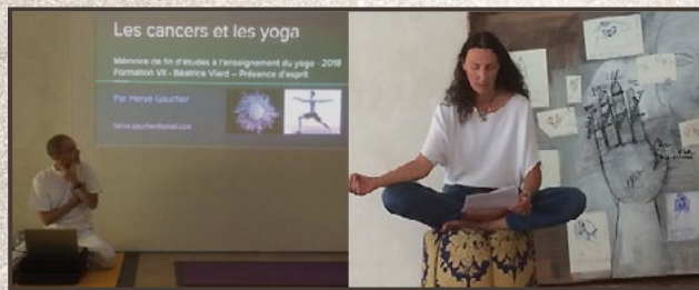
Soutenance de mémoire Mémoire sur les mudrā